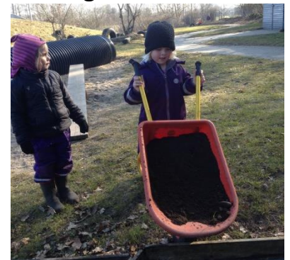
Så fik vi kørt nyt muld, (hentet fra muldvarpeskud) på og revet det pænt, så der er klar til at blive plantet.